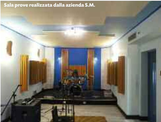
Sala prove realizzata dalla azienda S.M.

fasi di progettazione. Uno di questi indici descrittivi, al quale l'essere umano è particolarmente sensibile, è il cosiddetto tempo di riverberazione T60, misurato in secondi. Per una coppia sorgente-ricevitore, è definito come il tempo necessario affinché il livello di pressione sonora presente nell'ambiente decada di 60 dB, a partire dall'istante in cui è disattivata la sorgente che sosteneva il precedente regime stazionario (come visibile in figura 1 ). Dal punto di vista normativo, il riferimento attualmente più pertinente è la norma ISO 3382, che riguarda proprio la misura